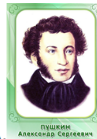
А. ПУШКИН Александр Сергеевич

8. Рассмотрите портреты поэтов и укажите, кто написал стихотворение «Туча»?