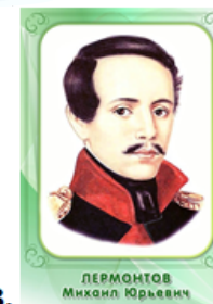
В. ЛЕРМОНТОВ Михаил Юрьевич